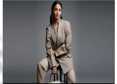
ALIA BHATT APPOINTED AS FIRST INDIAN GLOBAL AMBASSADOR OF GUCCI

(C) इटली के लज्जरी फैशन ब्रांड गुच्ची ने आलिया भट्ट को भारत से अपना पहला ग्लोबल एंबेसडर नियुक्त किया है। मीडिया रिपोर्ट्स के मुताबिक, आलिया अगले सप्ताह सियोल के ग्योंगबोकगंग पैलेस में होने वाले गुच्ची क्रूज, 2024 में इस ब्रांड की नई ग्लोबल एंबेसडर के रूप में नजर आएगी।